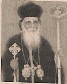
പ. മാത്യു മിശിയാസ് ഞേഗൻ പ്രമുഖൻ കാതോലിക്കാ ബാവ